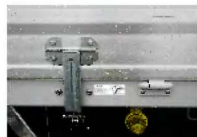
パワーラック コーションプレート貼付け例