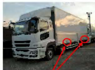
パワーラック 取り付け箇所

対象車両 : 三菱トラック・バス(株) 1992台 日野自動車(株) 101台 UDトラック・日産ディーゼル(株) 72台 いすゞ自動車(株) 93台 (該当車両 2,258台)