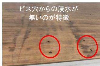
竹合板材 染み模様痕跡

竹合板材の床板において、床材表面に『染み模様の痕跡』が発生する事例がございますが、これは空気中の水分などが床材表面に吸着する竹材特有の特性で、そこに汚れが付着した状態のものであり、 床下からの浸み上がりではありません。