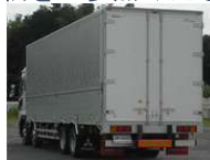
ロールゲートパネルタイプ

弊社製ウイングボデーにおいて、床下（タイヤ上部）からの止水性能を一層向上させるため、構造の見直しを実施しております。詳細につきましては、別紙をご参照ください。