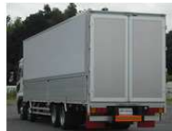
フラットパネルタイプ

平素より、パブコ製品に対し、尽力をつくして頂き有難う御座います。日々品質向上に取り組んでおりますが、我々に気付かない所が御座いましたら改善に努めて参りますので、今後ともご支援ご協力を宜しくお願い致します。