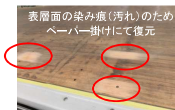
ペーパー掛けした様子