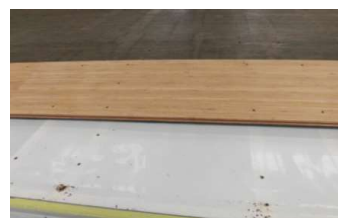
床板の裏面(浸水痕なし)