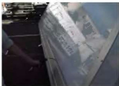
直接リベット取外穴へブロー