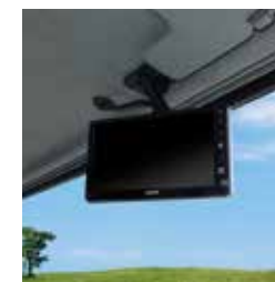
電子ルームミラー