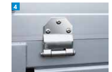
ステンレス製ヒンジ