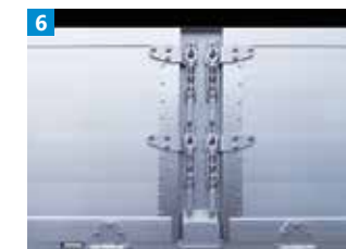
ステンレス製掛金2段