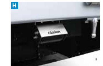
バックアイカメラ