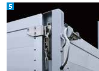
ステンレス製掛金