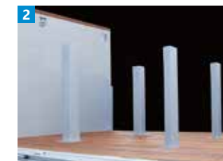
角材・スタンション2対