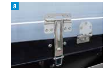
開閉補助装置(アーム: ステンレス製)