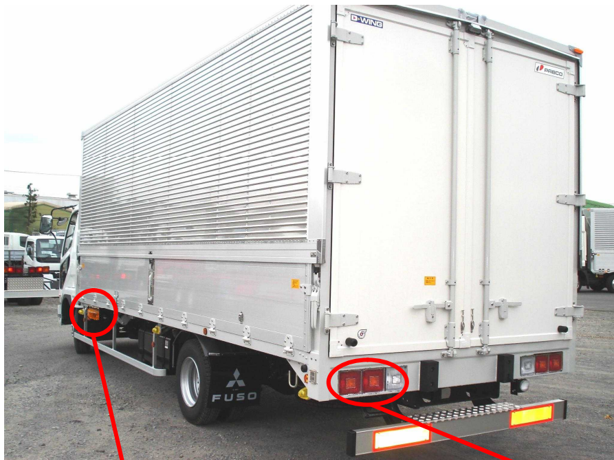
側面補助方向指示器