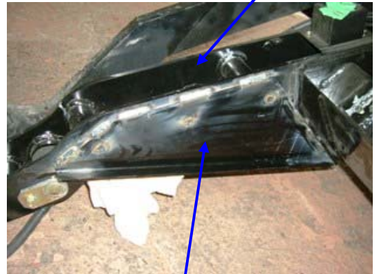
補強板(左右) 【追加部品】