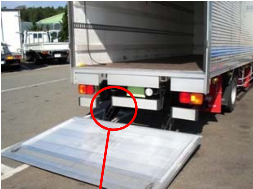
荷役用昇降装置 (商品名:コンビリフト)