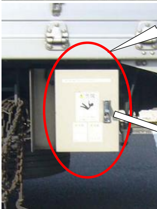
エアロールシステム コントロールボックス