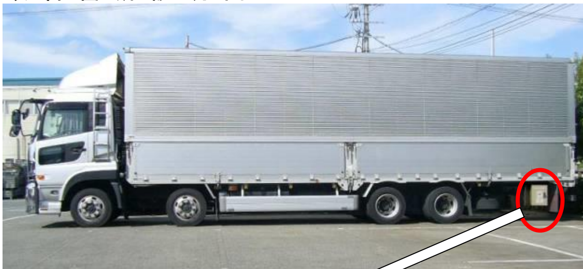
(エアロールシステム 装着車)