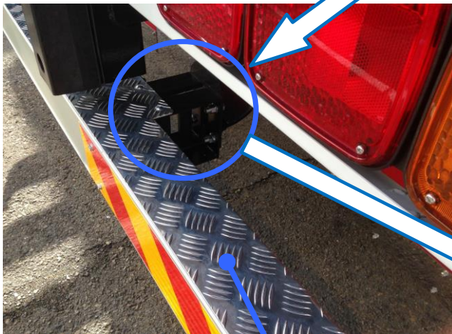
後部突入防止装置